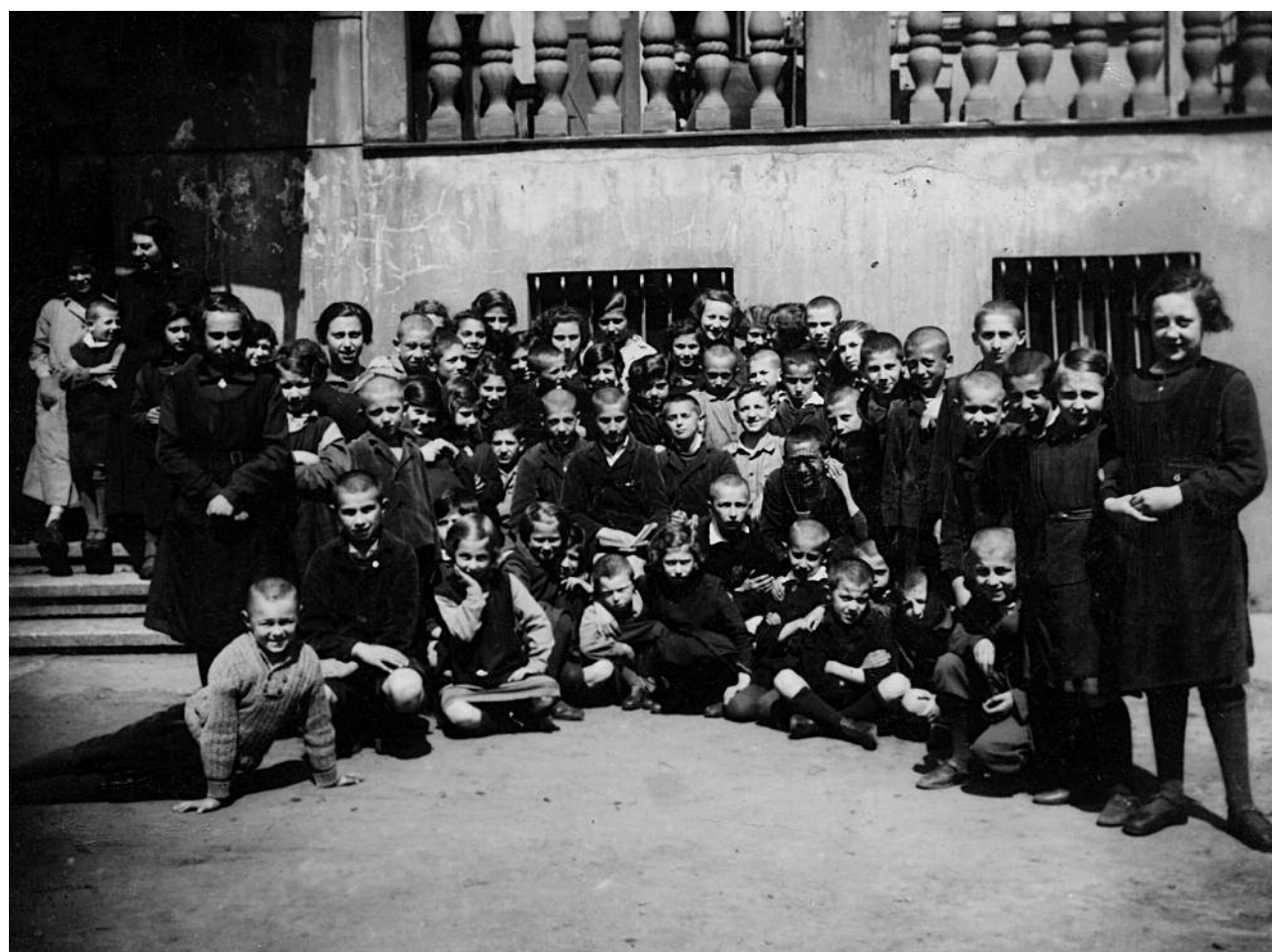
Ghetto Fighters House Archives