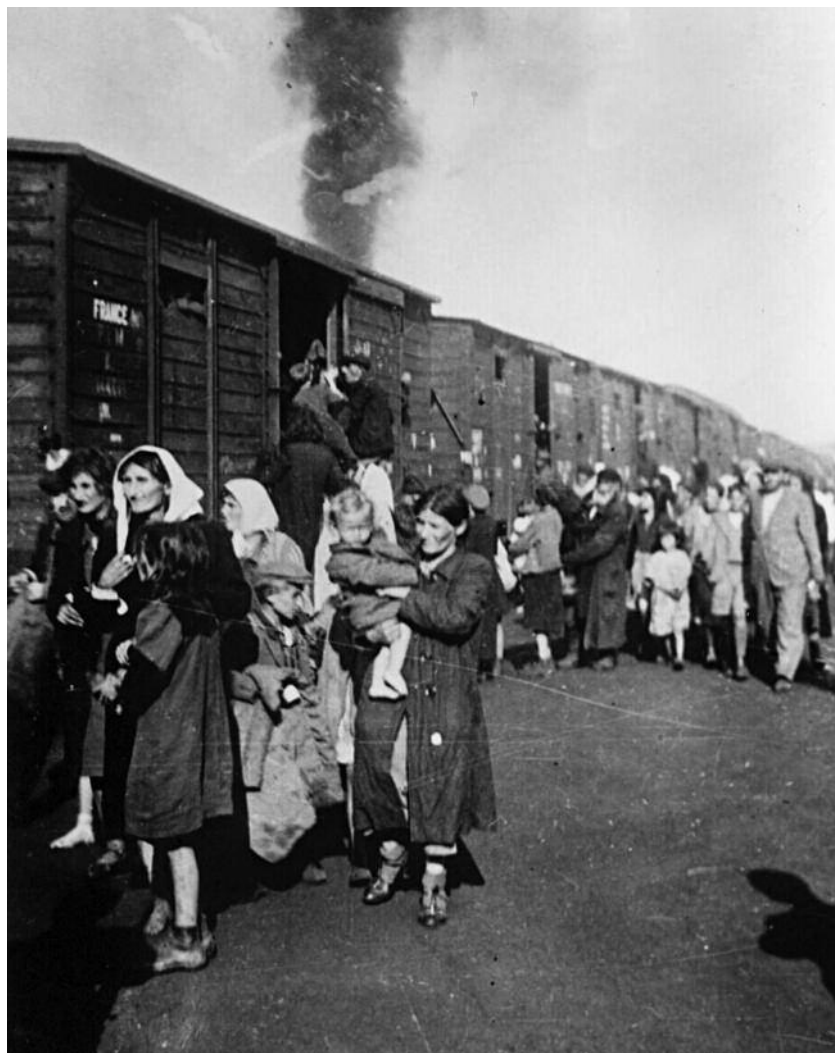
1942. Πολωνοί Εβραίοι από το γκέτο της Βαρσοβίας οδηγούνται με τρένα στο στρατόπεδο της Τρεμπλίνκα. Με τον ίδιο τρόπο, τον Αύγουστο της ίδιας χρονιάς, οδηγήθηκαν στη μαζική εξόντωση, ο Γιάνους Κόρτσακ και τα παιδιά του ορφανοτροφείου που διεύθυνε.

Ποιος είναι ο Γιάνους Κόρτσακ; Δίκαια θα αναρωτιούνται οι περισσότεροι έλληνας αναγνώστες, αφού το έργο του πασίγνωστου σε άλλα μέρη του κόσμου πολωνοεβραίου γιατρού, παιδαγωγού και συγγραφέα, δυστυχώς, είναι σχεδόν άγνωστο στην Ελλάδα. Μια μικρή έρευνα που πραγματοποίησα στον κύκλο των γνωστών μου έδειξε πως στην Ελλάδα το όνομά του συνδέεται κυρίως με το ομότιτλο κινηματογραφικό έργο του Αντρέι Βάιντα ( Korczak , 1990). Οι φανατικοί λάτρεις της Δέκατης Μούσας μπορεί να ξέρουν και ένα άλλο φιλμ αφιερωμένο στον Γιάνους Κόρτσακ, μια γερμανο-ισραηλινή παραγωγή του 1974 σε σκηνοθεσία