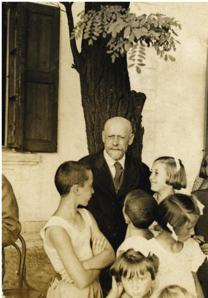
Ο «Γερο-Δόκτωρ» με τα παιδιά του ορφανοτροφείου.

Δεν θέλω να γίνω εικονοκλάστης και να απομυθοποιήσω μερικά πράγματα, αλλά πρέπει να πω πώς το είδα τότε. Η ατμόσφαιρα ήταν διαποτισμένη με τεράστια αδράνεια, αυτοματισμό και απάθεια. Δεν υπήρξε ορατή συγκίνηση για το πρόσωπο του Κόρτσακ, δεν υπήρχαν στρατιωτικοί χαιρετισμοί (όπως περιγράφουν κάποιοι), σίγουρα δεν υπήρχε παρέμβαση του Judenrat – κανείς δεν πλησίασε τον Κόρτσακ. Δεν υπήρχαν χειρονομίες, δεν υπήρχαν τραγούδια, ούτε υπε-